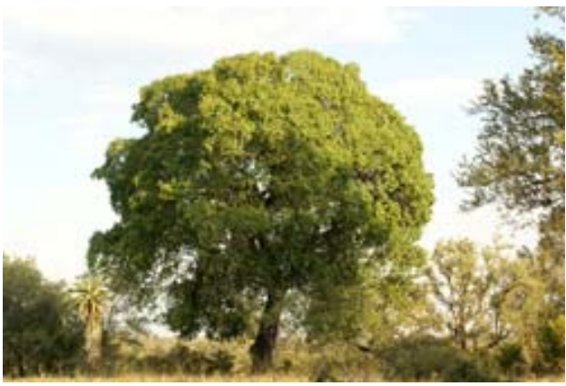
Aan de Seekoeistraat (MP)