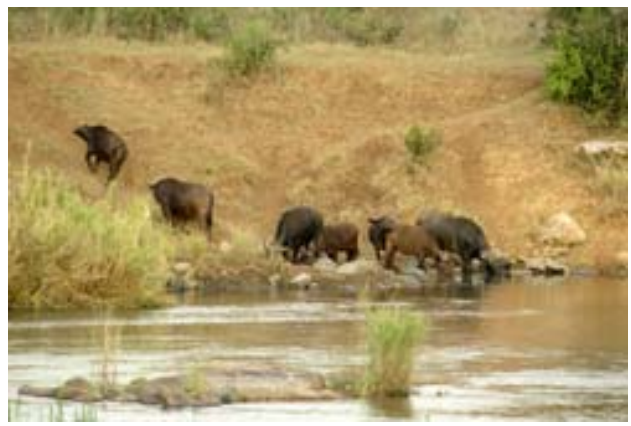
Rivier de Krokodil (200 mt van Mhofu!)